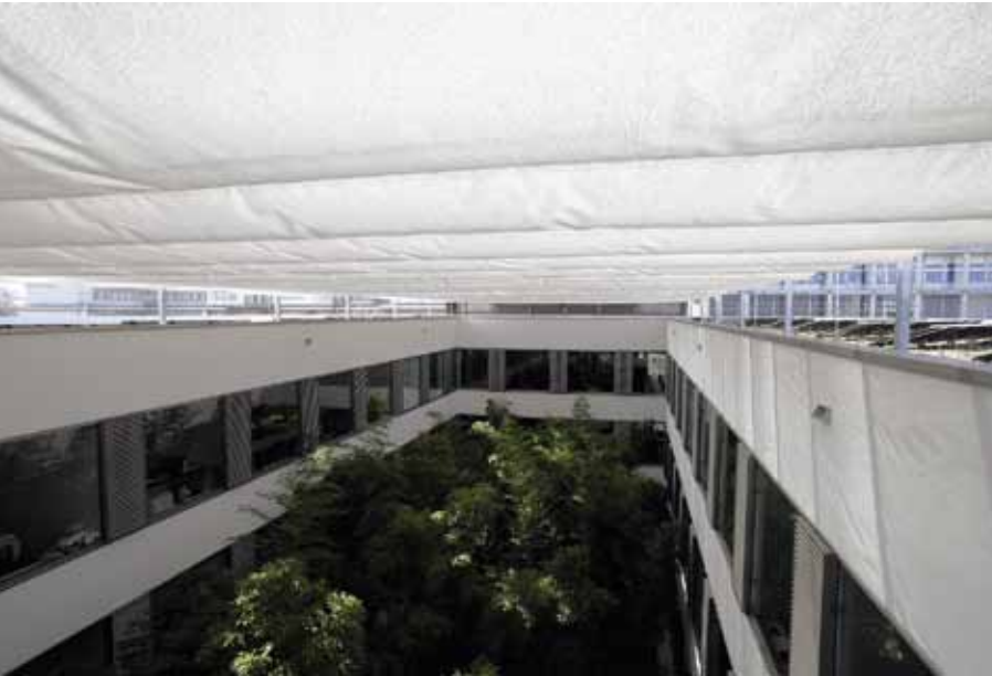
Sun Top 3100 Storen von Kästli+Co. AG, Belp-Bern